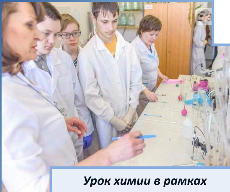
Урок химии в рамках проекта «Точка опоры»